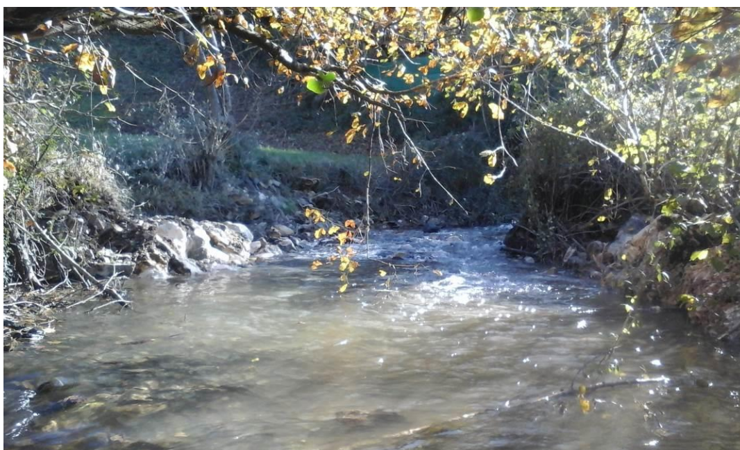
Aspecto de la regata vista desde aguas abajo de la antigua ubicación de la presa