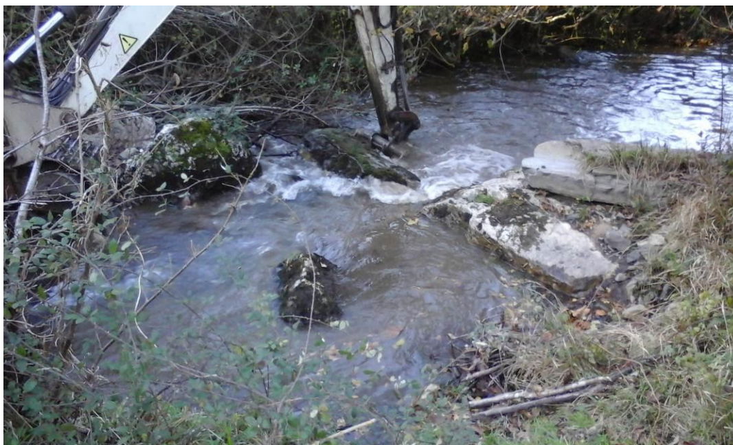
Proceso demolición presa