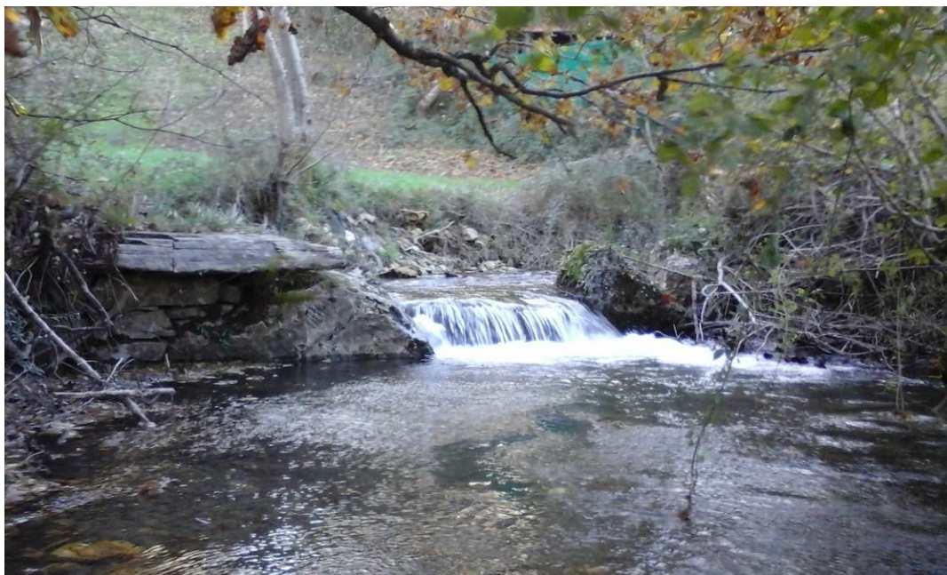
Imagen de la presa desde aguas abajo

La situación inicial, previo actuaciones en la presa de la regata Txaruta, presentaba la situación que a continuación se representa en las siguientes imágenes: