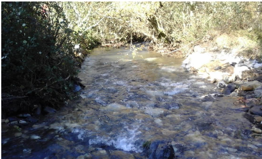
Aspecto del cauce visto desde aguas arriba de la anterior ubicación de la presa

Una vez terminada la demolición del azud, recuperando la morfología inicial de la regata Txaruta mediante el regularizado del material procedente de las obras y naturalizado el cauce, el aspecto de la zona de trabajo es: