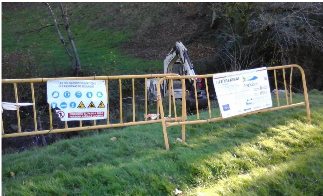
Vallado zona actuación y acceso de la maquinaria al cauce

Una vez se valló la zona de actuación, se procedió a la demolición de la presa, según se representa a continuación: