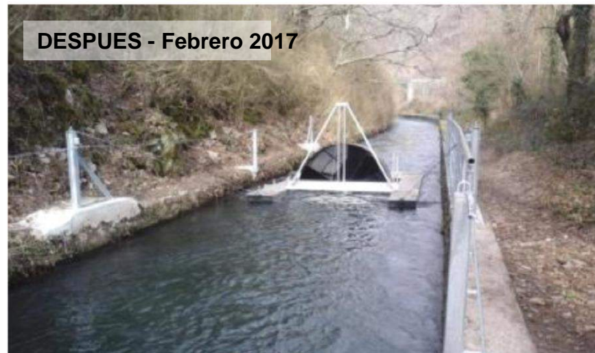
DESPUES - Febrero 2017

Realización seguimiento población esguines salmón en su descenso al mar.